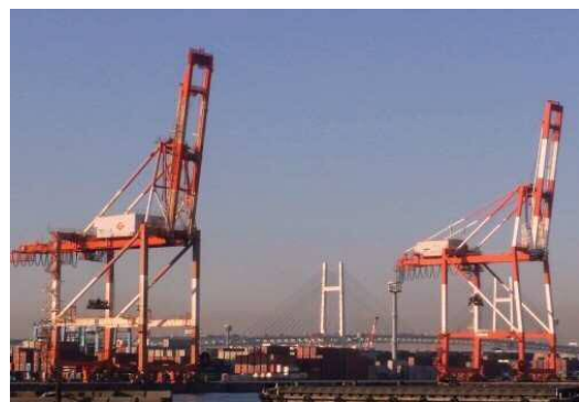
写真 2. C-2、C-3 号機クレーン