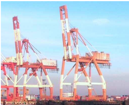
写真 1. D-3、D-4 号機クレーン